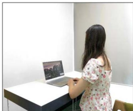
图3：侧后方第二机位效果图